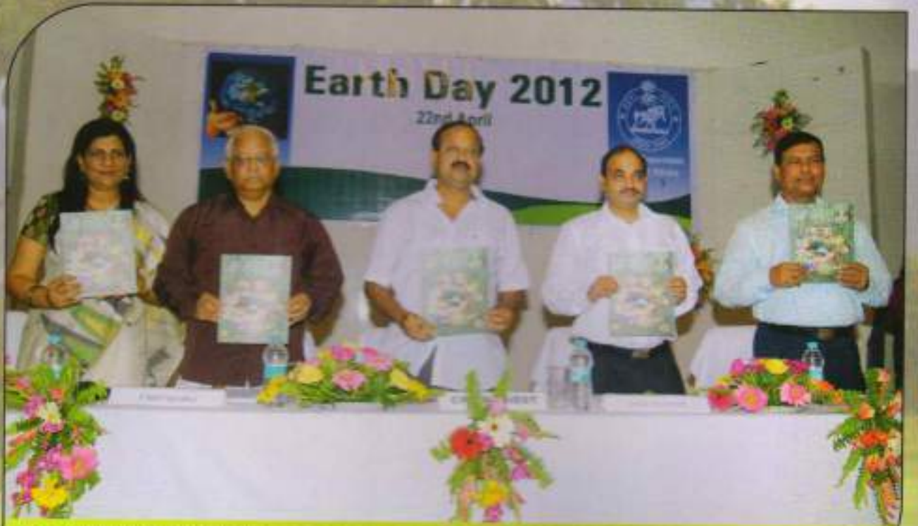
ବିନାମୀର ୧ମ ସ୍ତମ୍ଭରଣା ମାନ୍ୟତା ଉପାଳାନ୍ତ ଉତ୍ସବ ଓ ପରିବେଶ ମହତ୍ତ୍ୱ ଦୂରା ଧର୍ମିତ୍ରା ଦିବସ, ୨୦୧୨ରେ ଉଲ୍ଲୋକିତ