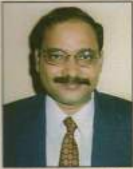
ରାଜ କୁମାର ଶର୍ମା ପ୍ରମୁଖ ଶାସନ ସଚିବ ଜଙ୍ଗଲ ଓ ପରିବେଶ ବିଭାଗ