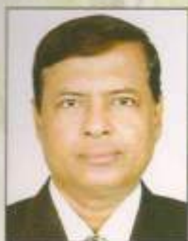
ପ୍ରିୟନାଥ ପାତ୍ର ପ୍ରଧାନ ମୁଖ୍ୟ ବନ ସଂରକ୍ଷକ, ଓଡ଼ିଶା