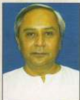
ନବୀନ ପଟ୍ଟନାୟକ ମୁଖ୍ୟମନ୍ତ୍ରୀ, ଓଡ଼ିଶା

ଦୈନିକତାଳ 0674 - 2531100 (Off.) 0674 - 2531099 (Res.) ଫାକ୍ସ 0674 - 2535100 (Off.) 0674 - 2590833 (Res.) ଇମେଲ : cmo@ori.nic.in ଫ. : 298