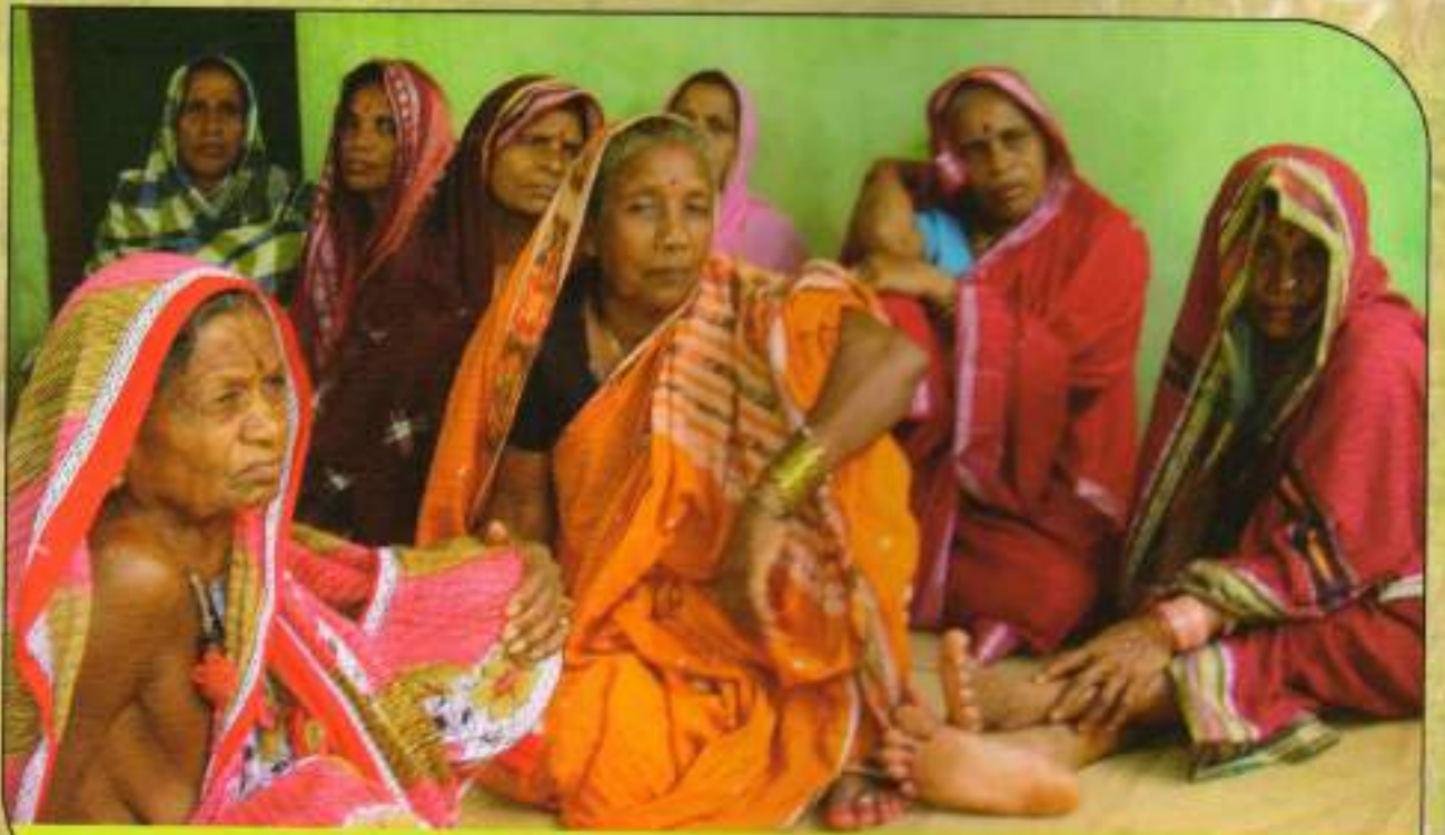
ଶ୍ରେଷ୍ଠ ବନ ସୁରକ୍ଷା ସମିତି ଦାଗମ-ଗିଡ଼ାଗ ଅଧିକାରୀଙ୍କ ସହ ସାକ୍ଷାତକାର